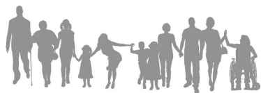
HOSPIZGRUPPE Aschaffenburg e.V.

Aber auch bei anderen Dingen, die hier nicht aufgezählt sind, wollen wir Ihnen gerne zur Seite stehen.